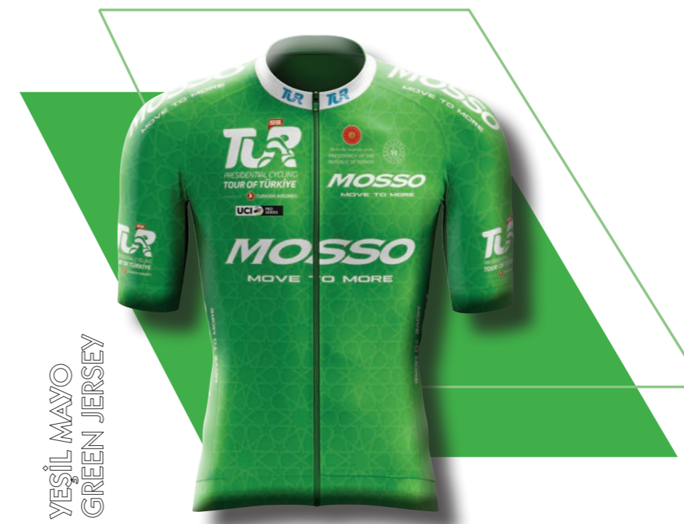
YEŞİL MAYO GREEN JERSEY