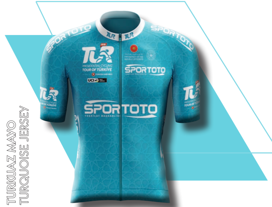
TURKUAZ MAYO TURQUOISE JERSEY