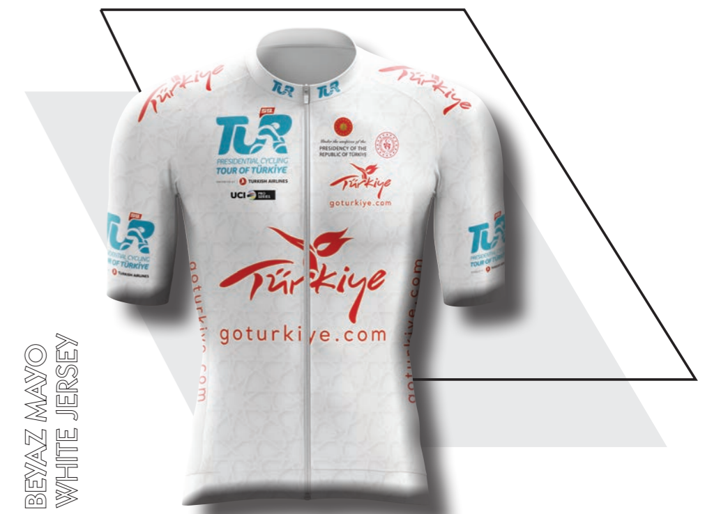
BEYAZ MAYO WHITE JERSEY