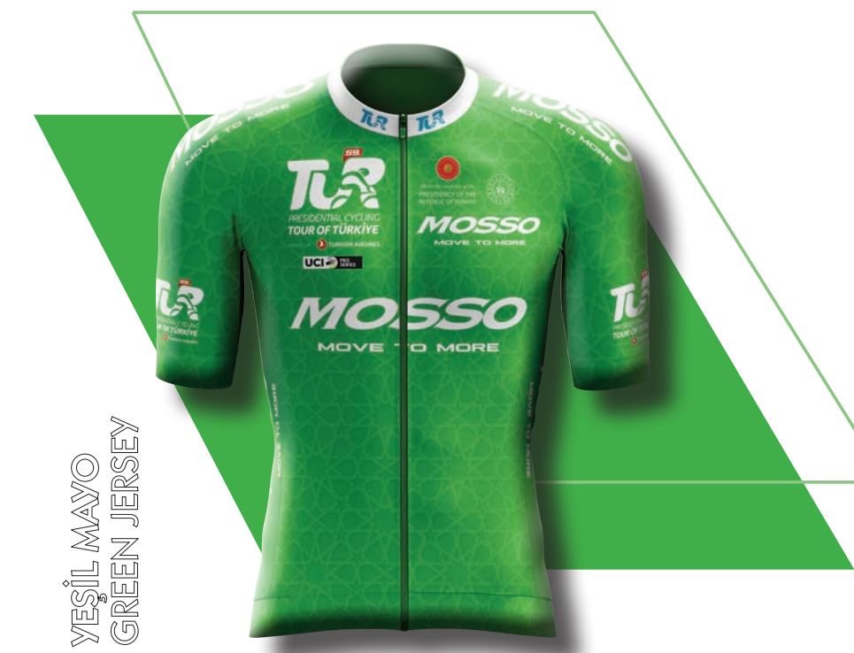
YEŞİL MAYO GREEN JERSEY