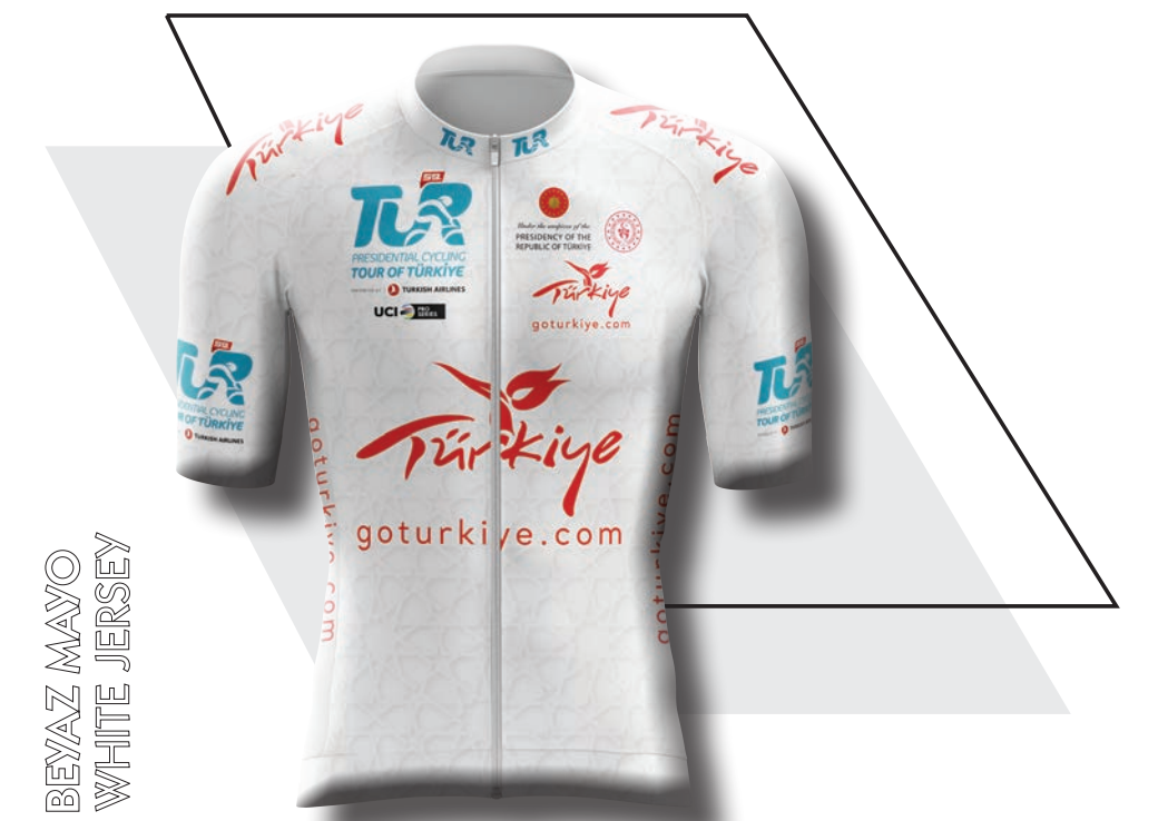
BEYAZ MAYO WHITE JERSEY