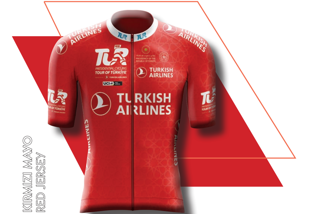
KIRMIZI MAYO RED JERSEY