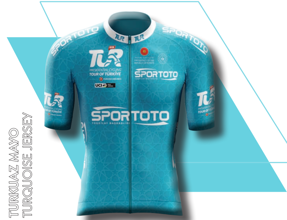
TURKUAZ MAYO TURQUOISE JERSEY