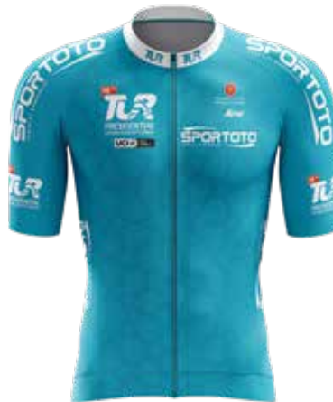
Turkuaz mayo Turquoise jersey Arvid de Kleijn (Rally Cycling)

Official classifications of TOUR - Stage 1