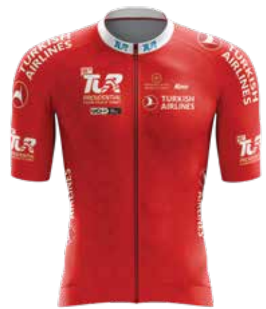
Kırmızı mayo Red jersey Ivar Slik (ABLOC)