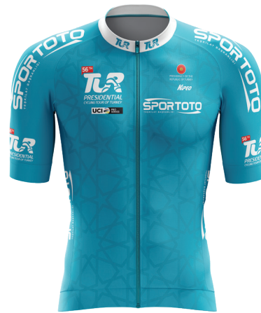
Turkuaz mayo Turquoise jersey