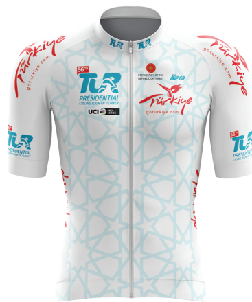
Beyaz mayo White jersey