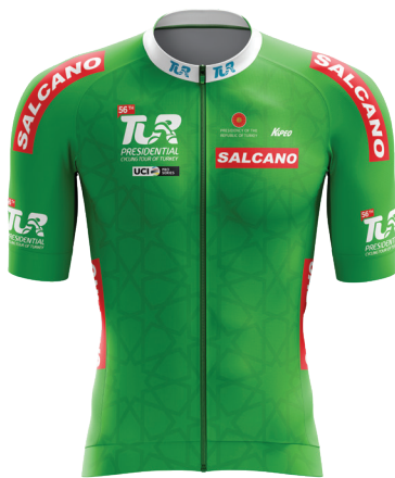
Yeşil mayo Green jersey

Bir Akdeniz şehri olması itibarıyla deniz ürünleri tüketmeyi sevenler için ideal bir durak olan Antalya'nın en meşhur lezzetinin ise mavi sularıyla pek bir alakası yok. Antalya'ya has Tahinli Piyaz, ilk bakışta ilginç bir tarif olarak görülse de, tadına bir kez bakanları asla pişman etmiyor.